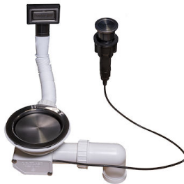
自动下水器 枪黑色 Space 8407 120