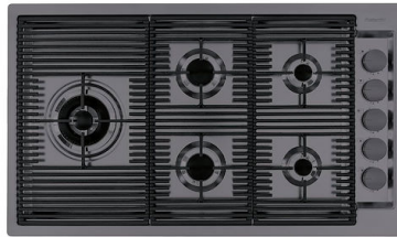
OUTLINE GAS H25 - GUN METAL 7441 006