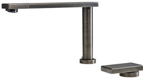
OP GUN METAL 8499 106